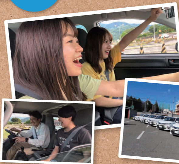
最新教習車 27台(普通車)