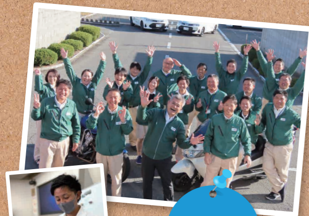
指導員21名 事務員5名