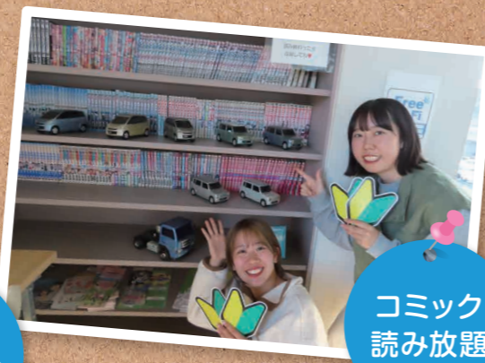
コミック 読み放題