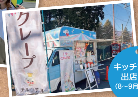
キッチンカー 出店予定 (8~9月・週1回)