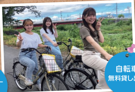
自転車 無料貸し出し