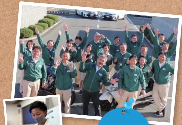
指導員20名 事務員4名