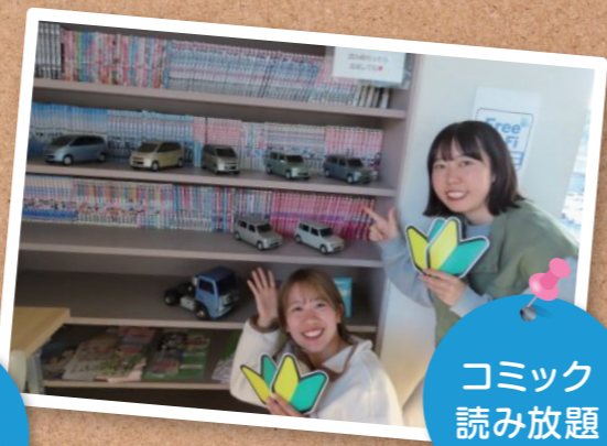
コミック 読み放題