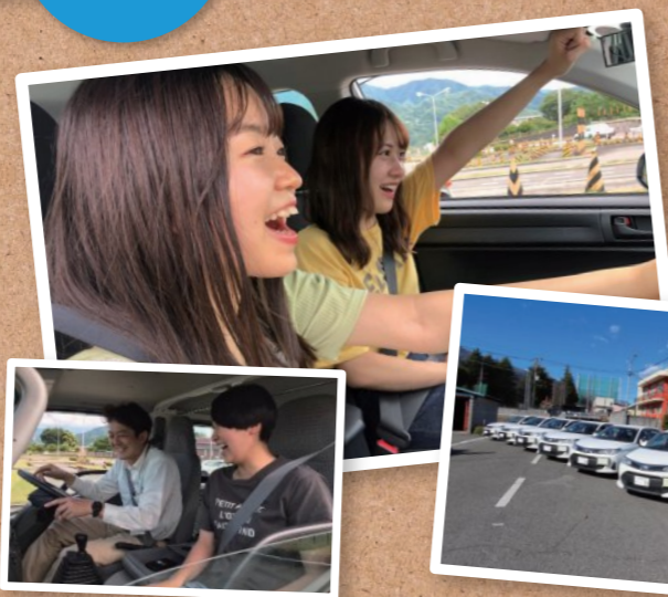
最新教習車 37台(普通車)