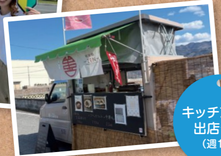
キッチンカー 出店予定 (週1回)